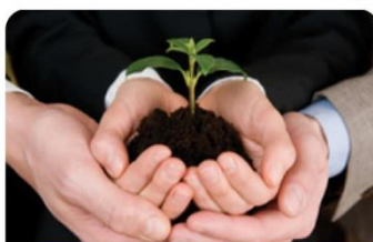
קורס יזמות עסקית