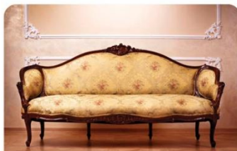
קורס הום סטיילינג

לראשונה במתנ"ס יואב/ מועצה אזורית יואב, נפתח קמפוס לימודים שמטרתו להעניק הכשרה מקצועית וקידום מקצועי ואישי לתושבי המועצה וסביבתה. תוכנית הקמפוס המוצעת מתבססת על הנושאים המועדפים ביותר מתוך סקר שהועבר לתושבי יואב. הקמפוס הינו דינמי ובהמשך הדרך יצרף מגוון רחב יותר של קורסים והכשרות, נשמח לקבל רעיונות נוספים לקורסים בהם הנכם מעוניינים וכך להשאיר אפשרות של התושבים להמשיך להיות מעורבים ומשפיעים. אנו שואפים לעידוד יצירת קהילה לומדת ומתפתחת, חיזוק תרבות של הרחבת אופקים ושיפור היכולות המקצועיות והאישיות שלנו בתחומים שונים ומגוונים וזאת על מנת לאפשר הצלחה בסביבה המשתנה שבה אנו חיים.