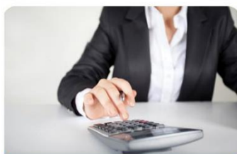
קורס כלכלת המשפחה