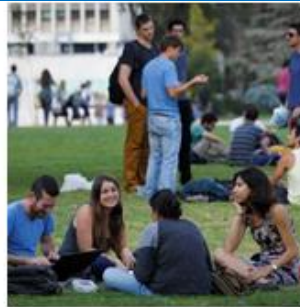
השכלה, לימודים וקריירה