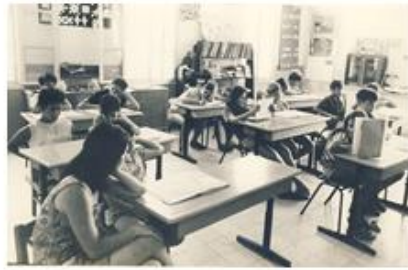
הפרטה, שכר דיפרנציאלי