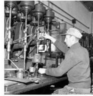
עסקים בקיבוץ (ענפים)