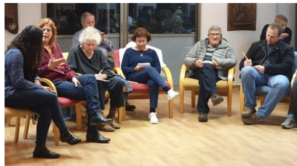
שקופיות מהמצגת שהכין לירון שקד