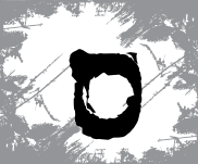
זמאנה סילוד זמאנה זמאנה סילוד זמאנה