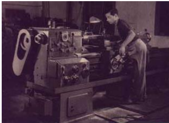
מכונה במפעל המתכת

עניין החשמל : עם התפתחותו של המשק, הקיבוץ נעשה יותר ויותר תלוי בחשמל. ...אך עיקר ההתקדמות תלויה כעת ברשת החשמל. נקווה שהקמתה לא תארך זמן רב ונוכל אז להשיג שתי מטרות: גם להוריד מחיר החשמל וגם לעזור לענפים בהתפתחותם.