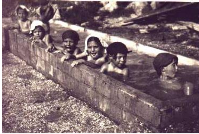
ילדים משתכשכים במים