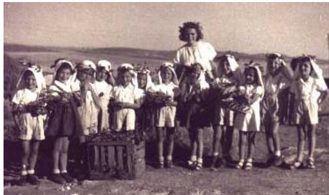
ילדי הקיבוץ מביאים ביכורים

הדסה כותבת רשימה על סיור במשק, אך במהות הרשימה בעיות השיתוף שהעסיק הקיבוץ לאחרונה בשיחות רבות, והפעם היא סוקרת המקלחות ה"פרטיות" שצצו כפטריות לאחר הגשם, ומזהירה בפני "מעמדות" שיכולים להיווצר בקיבוץ.