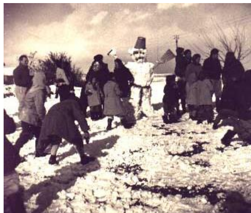
שלג בכפר מנחם