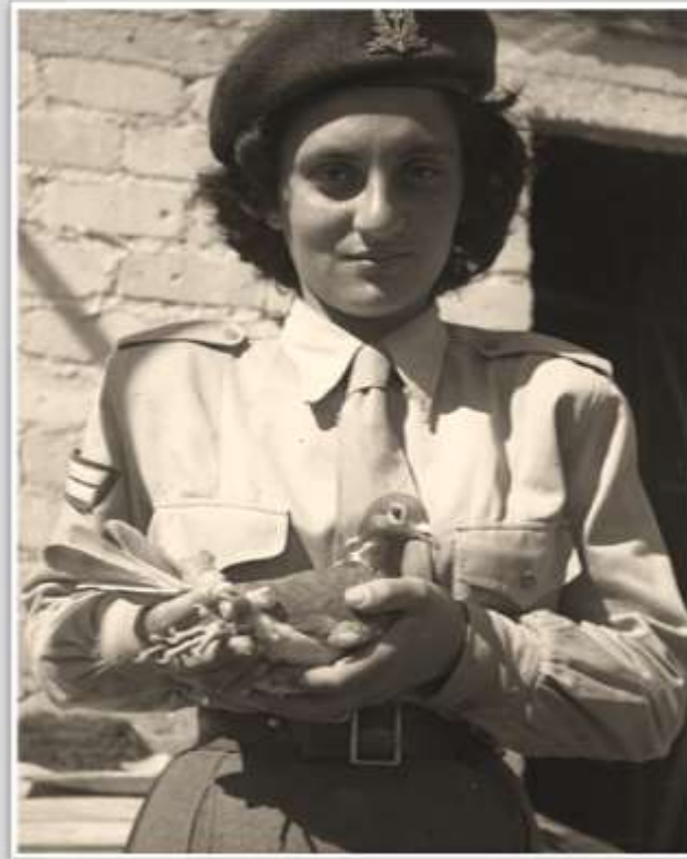
חיילת מחזיקה בידיה יונת-דואר