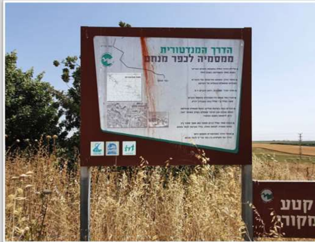
שלט ההסבר שמתאר את הכביש וסלילתו

לאחר מאמצים ניאותו השלטונות לסלול כביש מהכפר מסמיה אל הקיבוץ. תוואי הדרך הושפע ממיקומם של הכפרים הערבים ומשאלת הבעלות על הקרקע. אורך הדרך כ-7 ק"מ ורוחבה - 4 מטר.