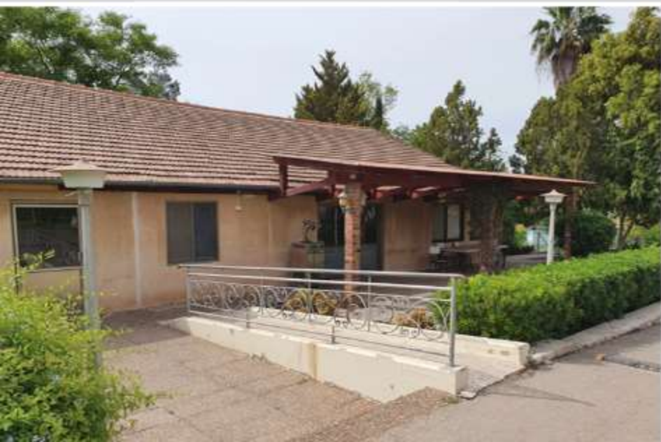
מימין: עמדת השמירה ושלט ההסבר על העמדה

יתרה מזאת, חרף הכינוי של גרעין המקימים, "כת רווקים", נוצרו משפחות ונולדו ילדים, והיה צריך לסדר עבורם תנאי מגורים טובים יותר מהאוהלים שהמבוגרים נאלצו להסתפק בהם בחודשים הראשונים. לפיכך, הבניין הראשון שנבנה בנקודה היה בית הילדים. הוא נחנך בינואר 1941, והיו בו חדרי שינה, מטבח, מקלחת ושירותים. (כיום הוא משמש כמזכירות ומועדון לחבר).