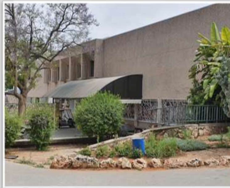
העורף של חדר האוכל. השטח מאחורי הסוכך הוא הכלבו של הקיבוץ

סגנון הבנייה הסגפני, נטול הקישוטים, התאים לרוח תקופת הצנע ודומה לזה של חדרי אוכל בקיבוצים רבים אחרים.