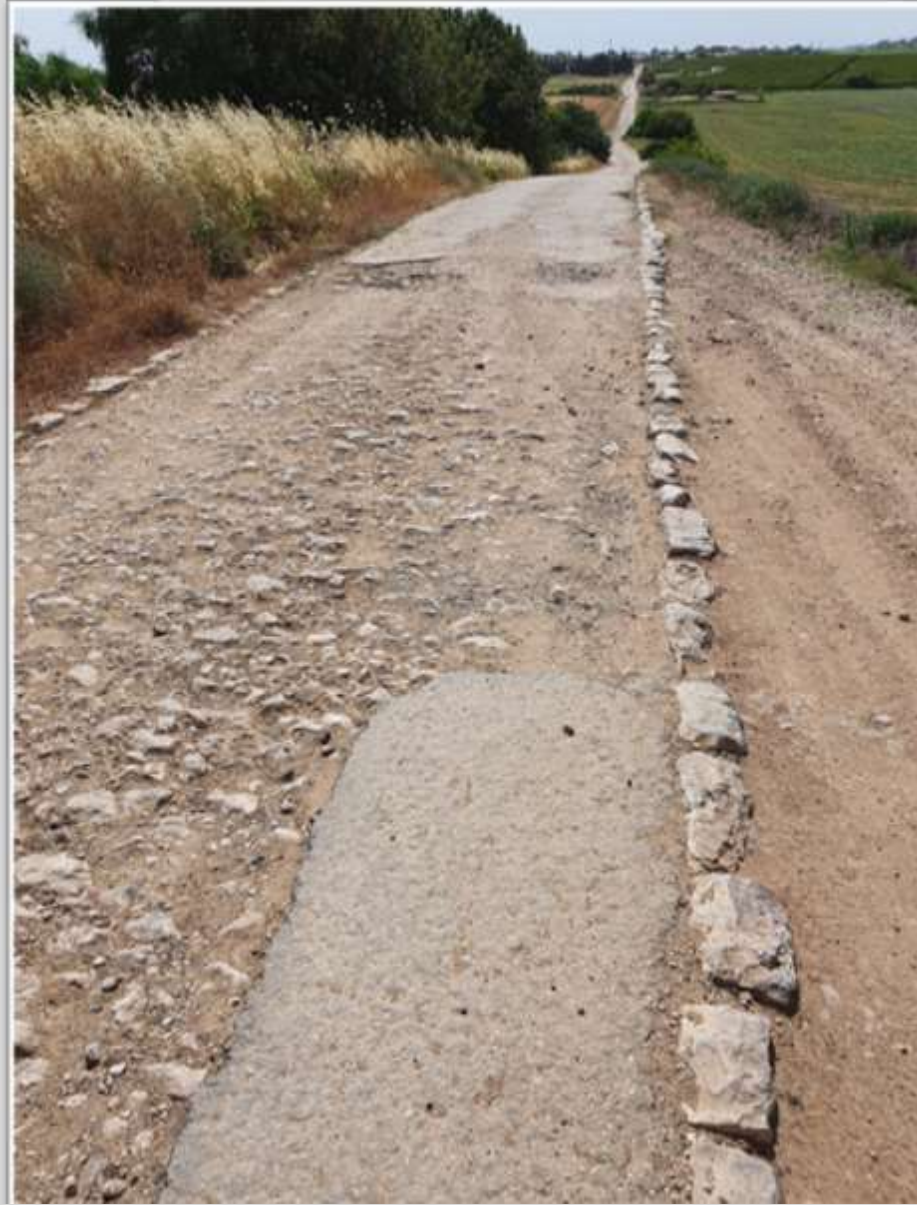
הכביש המנדטורי לכפר מנחם, שנסלל בשנים 1945-47

תוואי הדרך המנדטורית משמש כיום כדרך נוף חקלאית בין כפר הרי"ף לכפר מנחם.