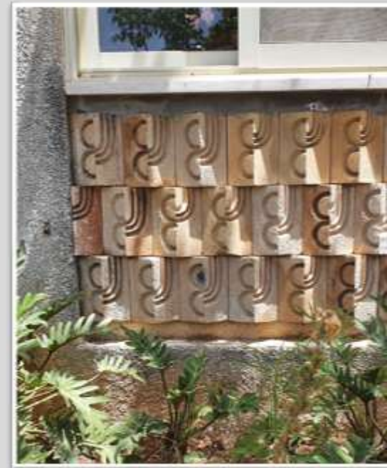
דוגמת האריחים מתחת לחלונות