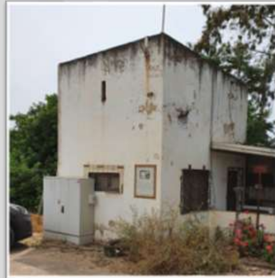
משמאל: בית הילדים הראשון