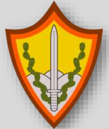
סמל חטיבת גבעתי

ב"קרבות עשרת הימים" (אמצע יולי 1948) חטיבת "גבעתי" השתלטה על מספר כפרים ברצועה הזאת, ובהם תל א-צאפי (כיום - תל צפית) הסמוך לכפר מנחם.