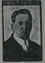
ד"ר משה שרת מזכיר כללי