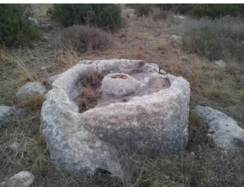
אבן שכב עדיין מחוברת לאבן האם (לכתישת זיתים או חיטה)

בכלל, יש לנו כאן אזור נפלא לטייל. על הגבעות אפשר לראות עשרות מחילות של תנים ומערות של דורבנים. על הגבעות יש גם הרבה שרידים ארכיאולוגיים גתות, אבני שכב, מערות קבורה, בורות סיד עתיקים, בארות מים ועוד.