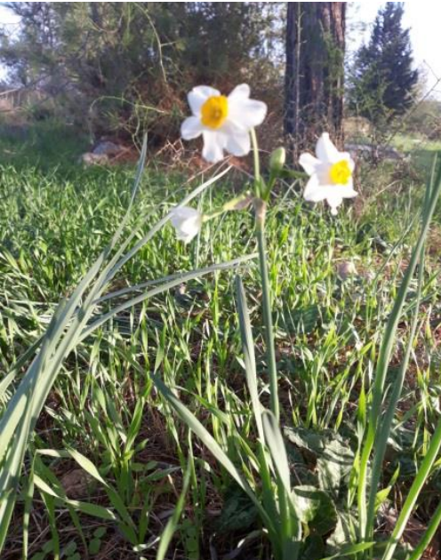
נרקיסים בגבעת הרקפות

הצפונית, הרקפות מופיעות בשיפוליה הצפוניים, סמוך לחלקת השקדים הצרה, שמגיעה כמעט לכביש לכיוון תחנת החשמל. בתחילת שנות החמישים הוקמה מעברת חרובית ותושביה (עולים מצפון