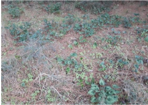
גבעת הרקפות השניה (מזרחית למחצבה)

כשהיינו ילדים היינו הולכים לטייל לגבעות שממזרח לקבוץ. בשנים אלו עוד לא נטעו את חורשות האורנים, שהיום מכסות כל גבעה. הלכנו לגבעת הרקפות וקטפנו הרבה מאוד רקפות, בכדי להביא הביתה ולקשט את בית הילדים. כל זה היה לפני שחוקק חוק להגנת הטבע. הגבעות היו מלאות סלעים גדולים, סירה קוצנית, זקנן, ברקנים ועוד עשבי בר למיניהם ועצי דומים. כשירדו הגשמים