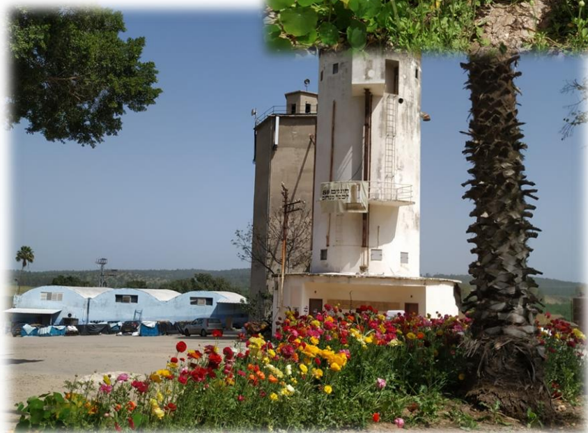
עת אביב הגיע