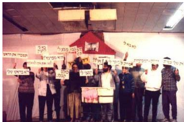
חגיגות חג היובל