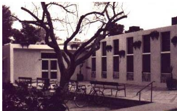
הכניסה לחדר האוכל, 1984