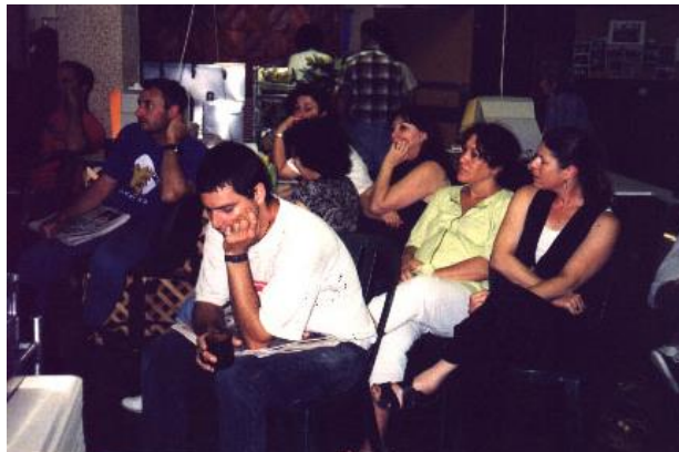
החברים הצעירים בשיחת קיבוץ