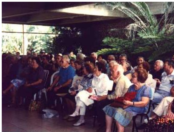
פעילות העשרה בבית הבנים

הודעה : ב-30 לאפריל, יום ראשון ב-21.00 בערב יתקיים בבית הבנים, בחסות המועצה האזורית, ה-1 במאי.