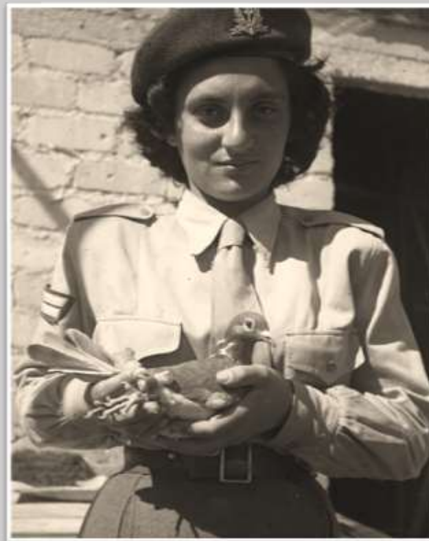
חיילת מחזיקה בידיה יונת-דואר