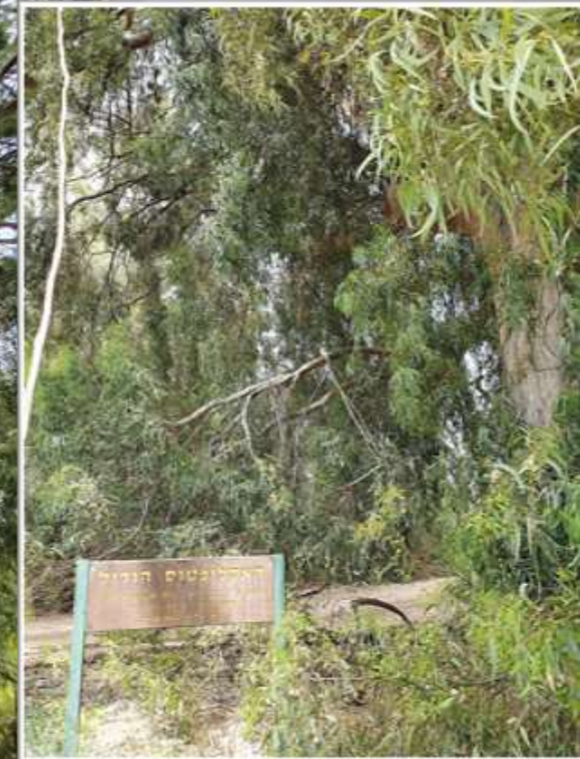
"האקליפטוס הגדול" (השווה לגודל המכונית למרגלותיו)