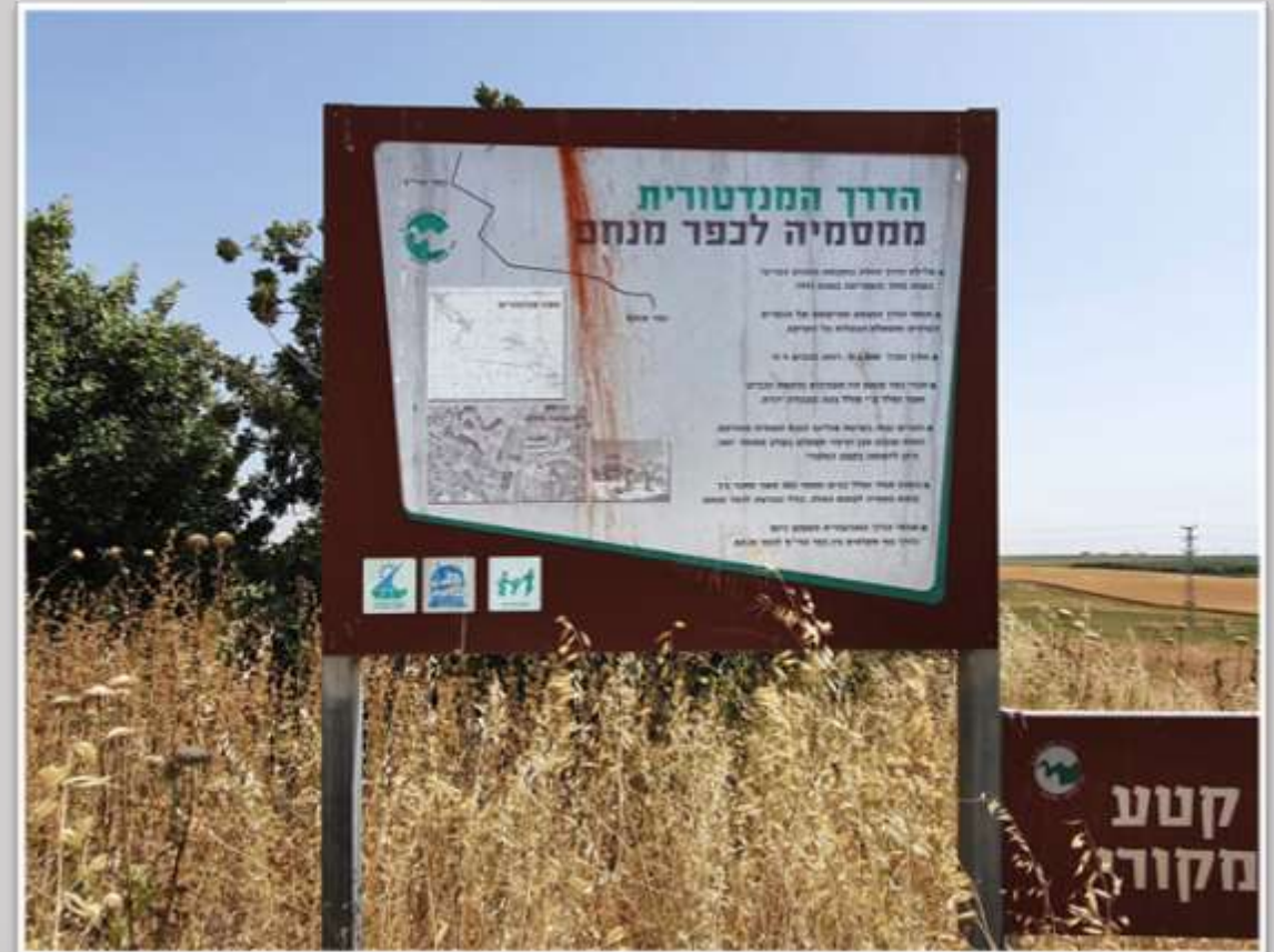
שלט ההסבר שמתאר את הכביש וסלילתו

הסלילה, ע"י חברת "סולל בונה", החלה בשנת 1945 והסתיימה בשנת 1947. חברי כפר מנחם היו מעורבים בהקמת הכביש.