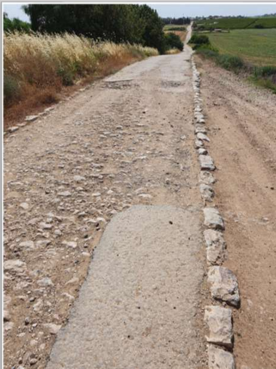
הכביש המנדטורי לכפר מנחם, שנסלל בשנים 47-1945

תוואי הדרך המנדטורית משמש כיום כדרך נוף חקלאית בין כפר הרי"ף לכפר מנחם.